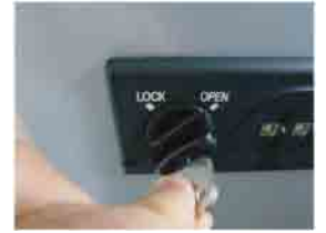
ツマミを右に90° 回します。