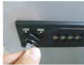
管理用キーを挿します。