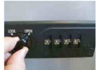
ツマミをLOCKからOPENに回します。暗証番号がリセットされました。