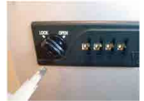
管理用キーを抜き取ります。