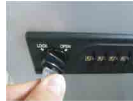
ツマミを左に90° 回します。