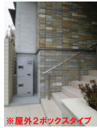
※屋外2ボックスタイプ