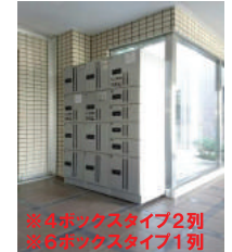
※4ボックスタイプ2列 ※5ボックスタイプ1列