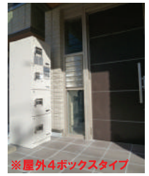
※屋外4ボックスタイプ