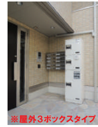
※屋外3ボックスタイプ